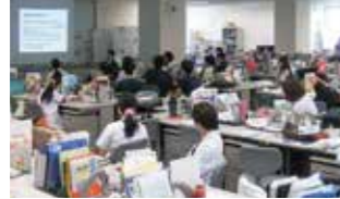
ランチョンセミナー

“研修医の医局”として用意されている研修医室は、高度医療人育成センター3階全フロアーを使い、一人一人に机とLANケーブルが用意されています。また、シャワールームやアメニティ部分も充実しています。