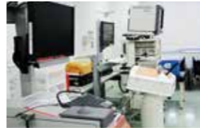
バーチャル内視鏡シミュレータ

シミュレータ教育を取り入れ、確実にあなたの身になる研修をサポートします。苦手な手技の修得やチーム医療実践のためのプログラムなど随時実施します。