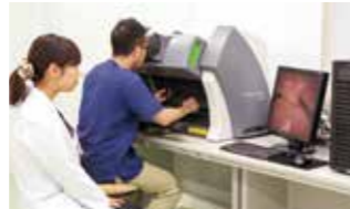
手術支援ロボットトレーナー