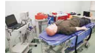
高機能シミュレータ