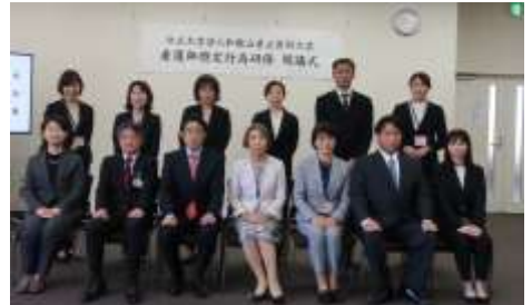
和歌山県看護協会会長(当時)、和歌山県医師課長を来賓にお迎えしました

4月13日に、11期生の開講式を執り行いました。県内の病院・訪問看護ステーションから6名の受講者を迎えました。今年度は放送大学での講義を受講し、令和9年9月の修了を目指します。