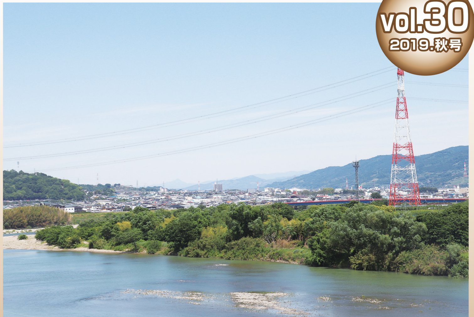
紀北分院から見える風景