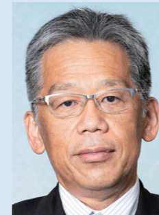
和歌山県立医科大学副学長 日本がんサポーターケア学会理事長 日本肺癌学会理事長 日本呼吸器学会常務理事 日本癌学会評議員 日本臨床腫瘍学会協議員

和歌山県立医科大学大学院医学薬学総合研究科がん薬物療法専門医養成コースの特徴は、学位（博士）やがん薬物療法専門医の取得のみならず、その後の専門医としての個々のキャリアパスを支援して、従来の臓器別がん診療の枠にとらわれずに、臓器横断的な幅広い領域のがん薬物療法に精通した国際的次世代リーダーとなる腫瘍専門医の養成を目指しています。