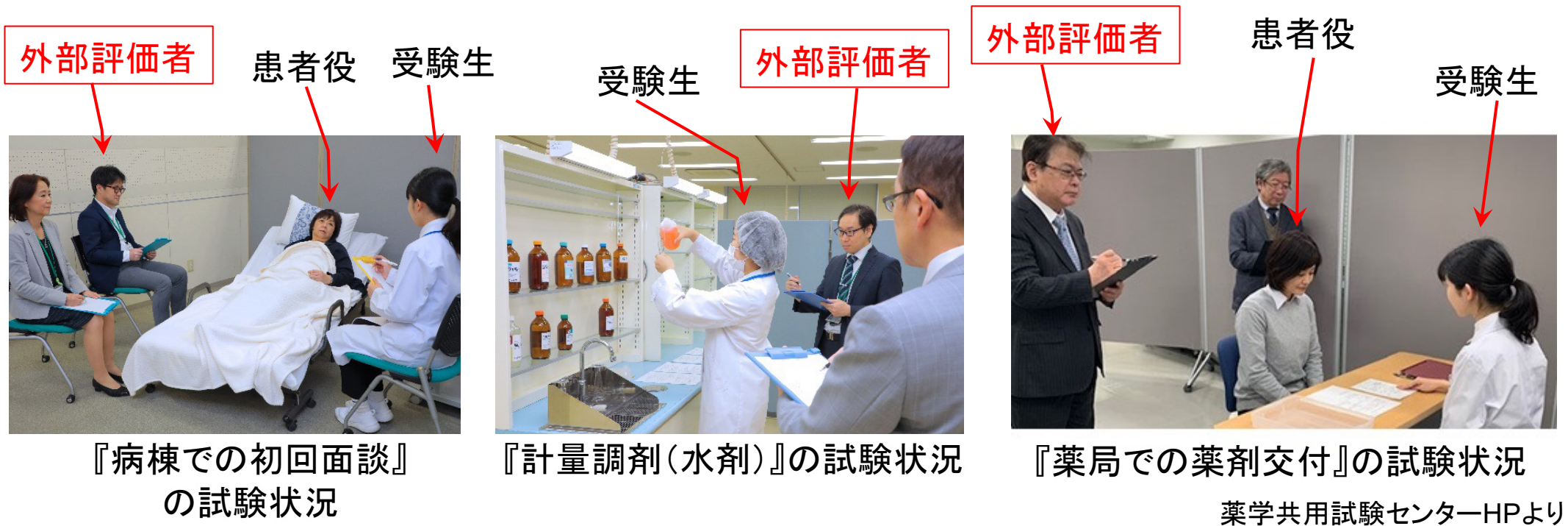
『病棟での初回面談』 の試験状況

外部評価者の方には、和歌山医大薬学部で実施される 講習会(養成講習会および直前講習会) に参加いただき、採点基準や当日の流れについて把握していただきます。