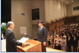
学位記授与：岡村吉隆学長