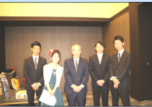
← 謝恩会実行委員会の皆さんと