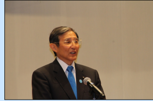
祝辞：仁坂吉伸県知事