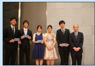
知事賞・学長賞・同窓会長賞授賞者の皆さんと