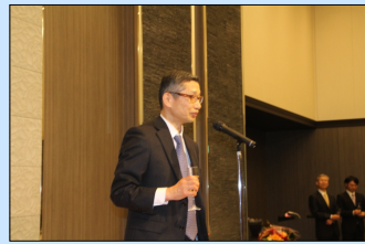
乾杯：村垣泰光教授