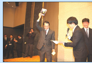
豪華賞品をゲット