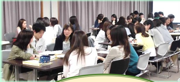
宿泊研修の様子↑ 理想の看護師像→

4月24日・25日に加太で行われた宿泊研修では、なりたい看護師像について話し合い、それぞれが1年後の目標を立てました。