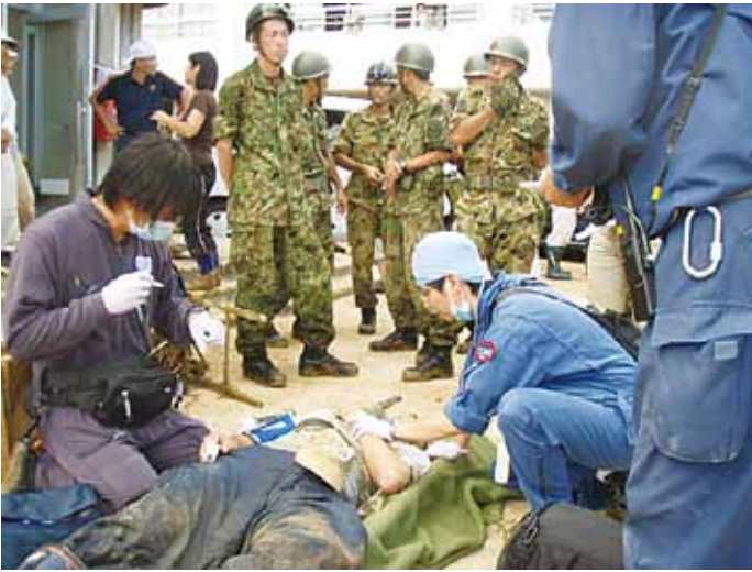
市野々小学校での DMAT 活動