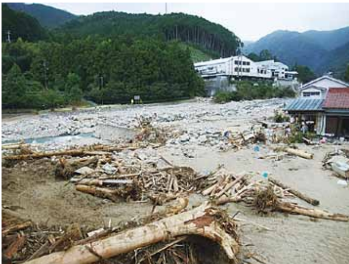
熊野川周辺の様子