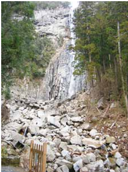
被災した那智の滝