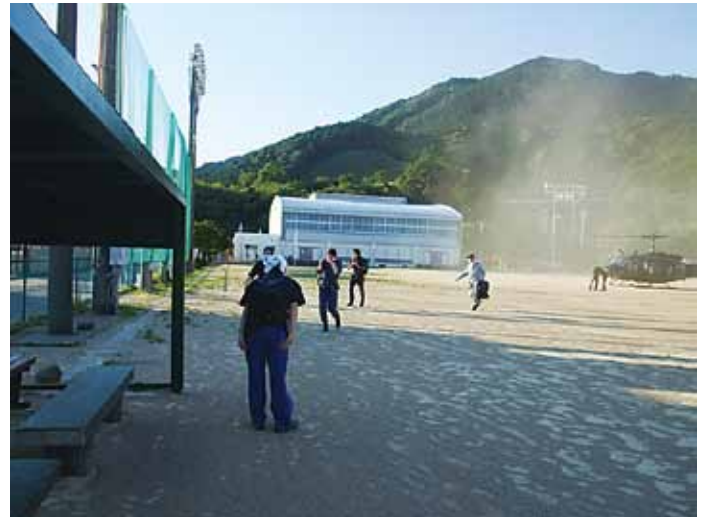
新宮市佐野市民グラウンドに帰着