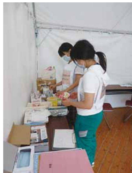
診療前の準備作業