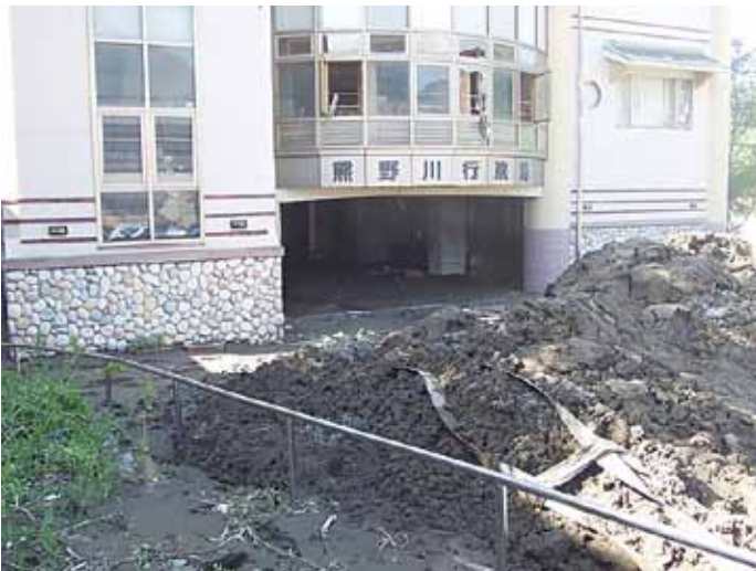
被災した熊野川行政局