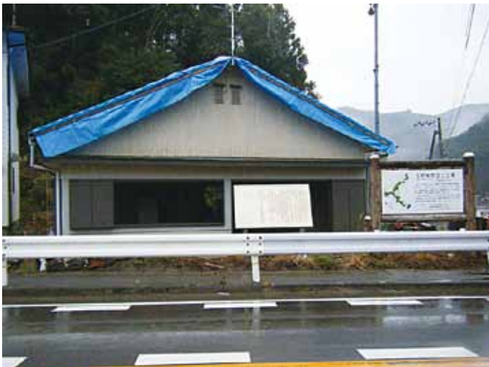
職員ボランティアの活動現場