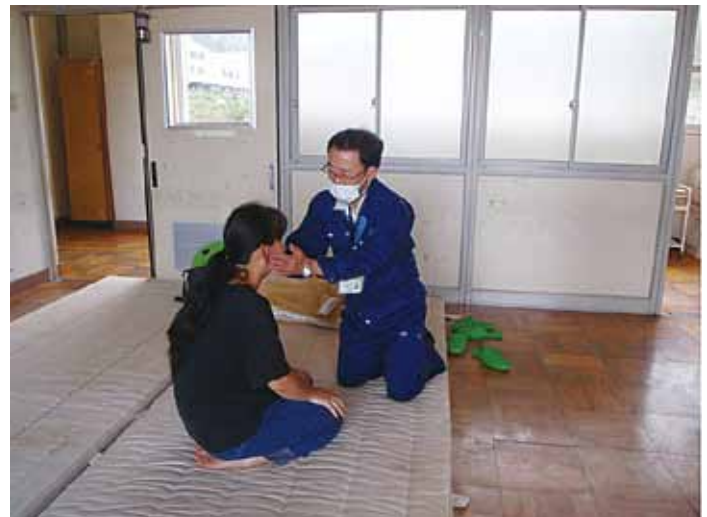
板倉学長診療風景