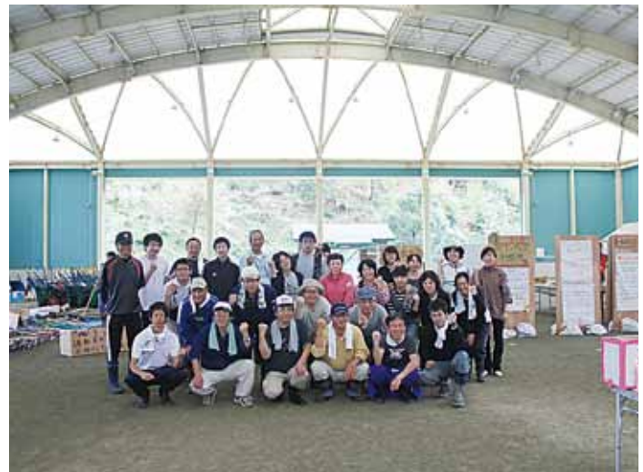
職員ボランティアメンバー