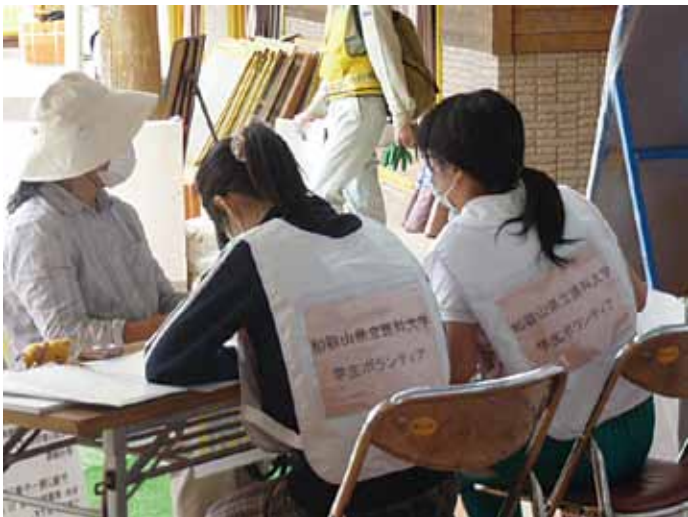
学生ボランティアの二人