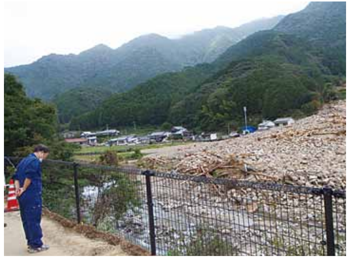
被災された方への黙祷