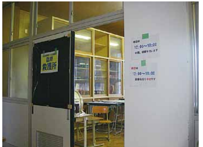
市野々小学校の臨時救護所入口