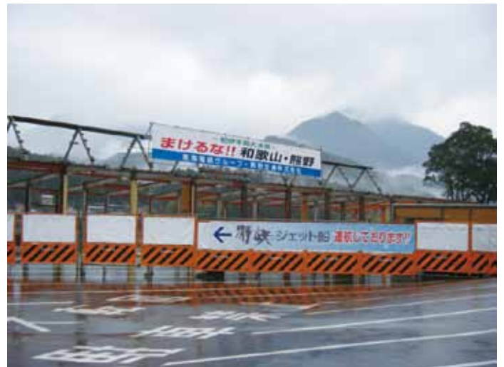
まけるな!! 和歌山・熊野