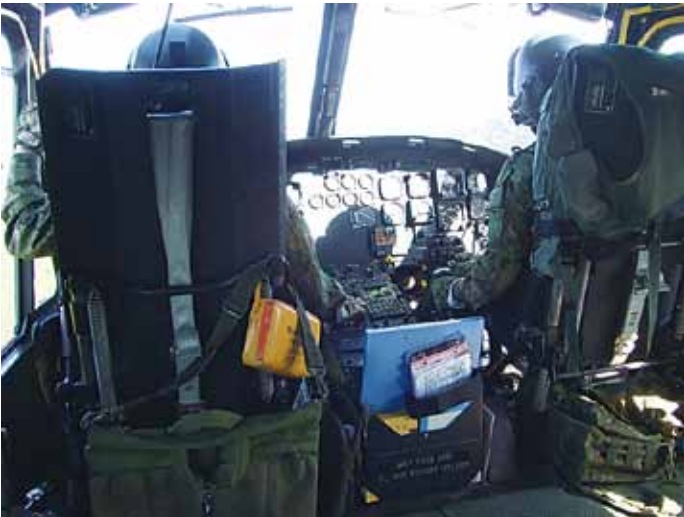
日足地区へ自衛隊のヘリで移動