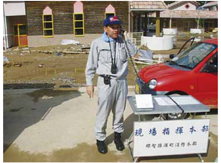
衛星携帯電話を使用して本学へ活動報告