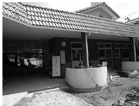
那智勝浦町の活動拠点となった「井関保育所」