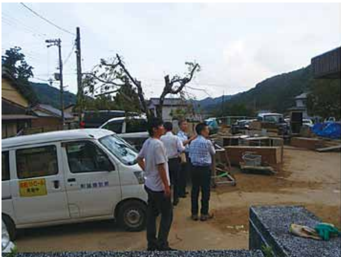
医療ニーズの情報収集