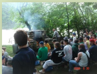
イブニング・キャンプファイヤー