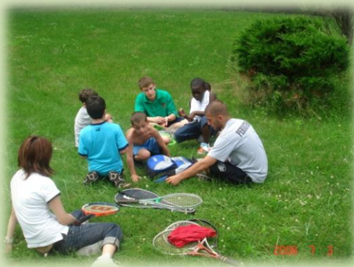
運動療法中の血糖測定