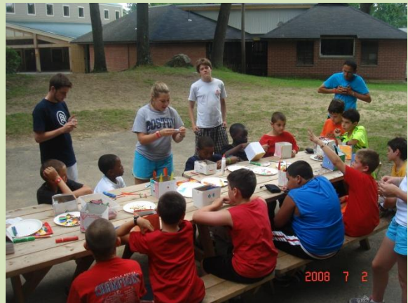
糖尿病教育・指導