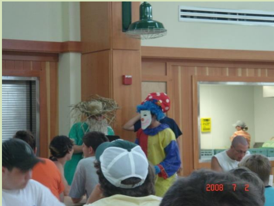
栄養士のパフォーマンス