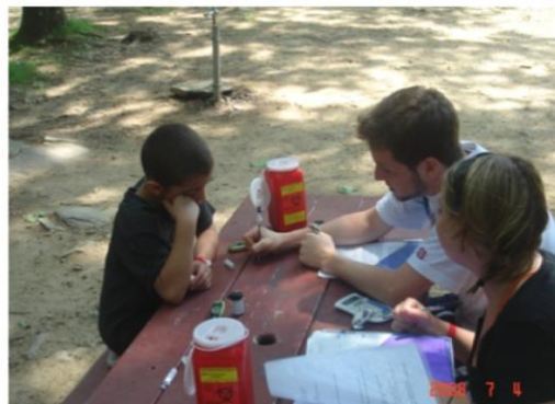
血糖測定の結果説明・指導